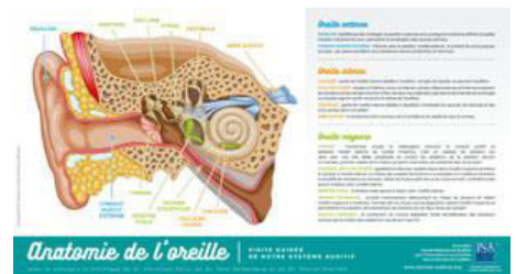
Affiche « L'ouïe et ses impacts santé »

Merci de retourner ce formulaire par courrier ou par mail à :