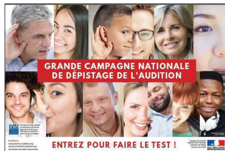
Affiche de la Campagne de dépistage auditif 3 e Edition 2019