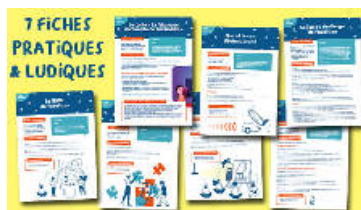
Les fiches pratiques