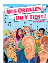
La brochure Nos Oreilles On Y Tient