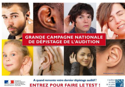
Affiche de la Campagne de dépistage auditif 5 e Edition 2021