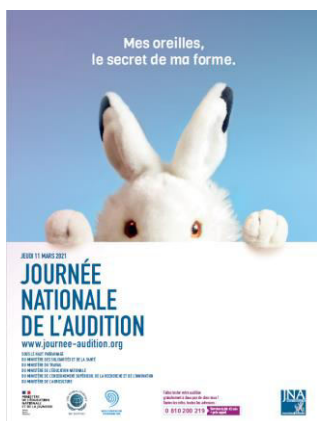
Affiche officielle de la Campagne JNA 2021